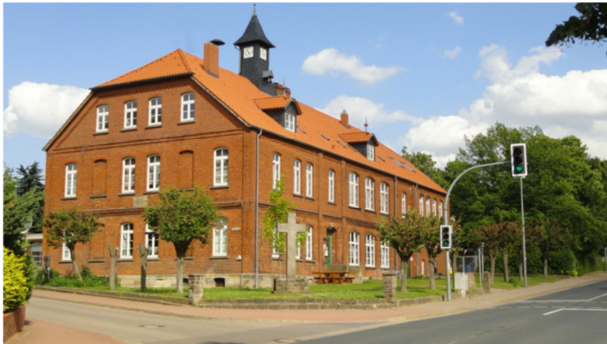
Haus der Heimatstube, dem Ortsmuseum in der Ortsmitte von Bredenbeck, Am Lindenplatz, Wennigser Straße 23