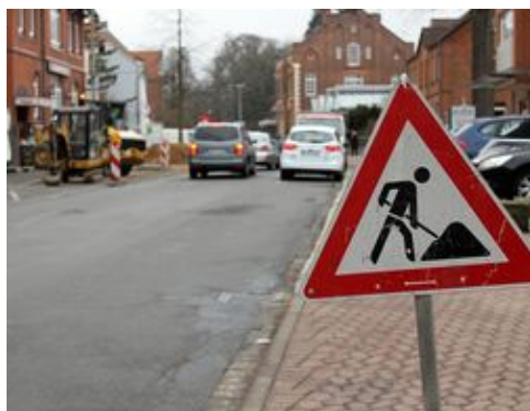
Baustelle Hauptstraße Wennigsen.